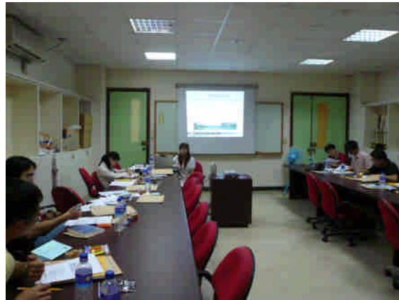
教務處課務組談網路選課作業與問題解決