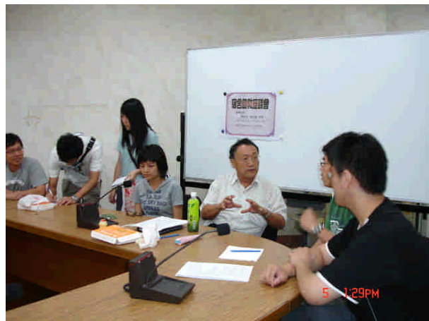
住服組喬治國組長定期與宿舍助教分享住宿服務觀念與技巧。