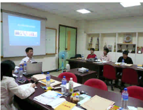
課外活動組介紹校內社團與資源，發展學生服務社會的精神並營造校園多元學習環境。