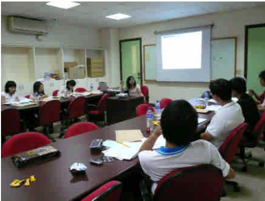
衛保組護理師授與校園傷病處理技巧